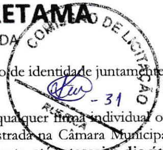
FOTO RECENTE: na hipótese de sócio ou diretor, apresentar documento de identidade juntamente com os envelopes de habilitação e propostas, mas não incluídos nestes.