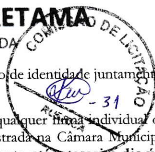
FOTO RECENTE: na hipótese de sócio ou diretor, apresentar documento de identidade juntamente com os envelopes de habilitação e propostas, mas não incluídos nestes.